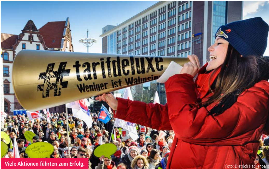
Viele Aktionen führten zum Erfolg.