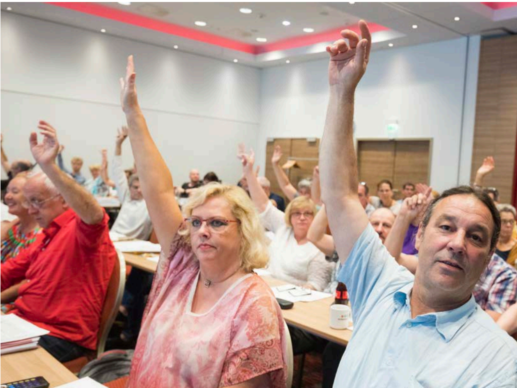
Die Bundestarifkommission stimmt über die Annahme des Tarifergebnisses ab.